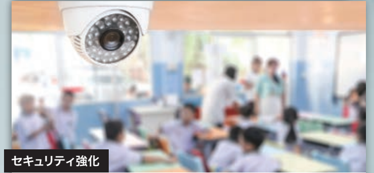
セキュリティ強化

「auスマートフォン」と「LINE WORKS with KDDI」(注1)を導入。社員間の連絡や情報共有のスピードが大幅にアップし、幅広い業務の効率化と社内コミュニケーションの深化を実現しました。