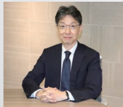
KDDI まとめてオフィス株式会社 代表取締役社長

KDDI まとめてオフィスグループは、KDDIの法人事業の一翼を担う子会社として2011年に設立しました。 以来、さまざまなお客さまのご要望や課題に対し、お客さまの想定や期待値を超える仕事の効率化やクオリティ向上を実現する新たな働き方をご提案させていただくことで、ご信頼にお応えしてまいりました。 コロナ禍以降、非接触社会への急速な変化を余儀なくされ、日本はデジタル化×AI世界へと大きく舵をきり、コミュニケーションの在り方そのものが大きく変わりつつあります。これらの変化は、人々を場所や時間の制約から解放し、新たな生産性の高い効率的なワークスタイルへのシフトを促進することになるでしょう。 私たちは、お客さまに必要で最適なワークスタイルをご提案し、それを実現するためにKDDIの高品質な通信ネットワークをバックボーンにクラウドやIoTといった次世代の技術からオフィス機器や防災グッズに至るものまでをワンストップで提供しサポートしてまいります。