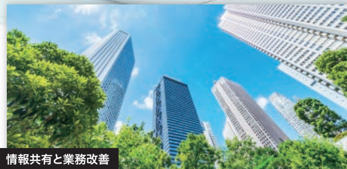
情報共有と業務改善

教室の防犯対策の強化と、離れた場所にある教室の運営状況を確認するために「まとめてネットワークカメラ with safie」(注2)を導入。不審者の侵入抑止のほか、各教室のセキュリティ管理が可能に。