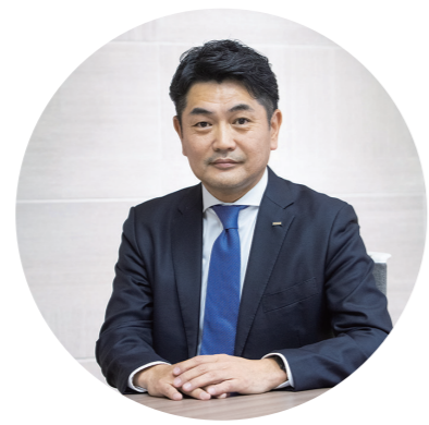
KDDI まとめてオフィス株式会社 代表取締役社長

信頼してお任せいただける真のパートナーになることを使命とし、お客さまとともに、『はたらく未来』を共創する会社であり続けます。