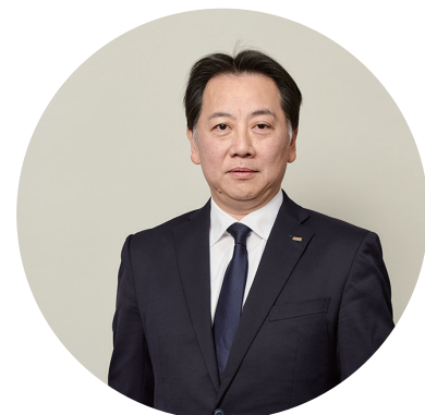
KDDI まとめてオフィス株式会社 代表取締役社長